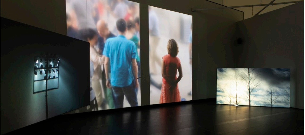
Rita Jokiranta, Life as It Flees , 2017/2023, 5-kanavainen videoinstallaatio, taiteilijan omistuksessa.