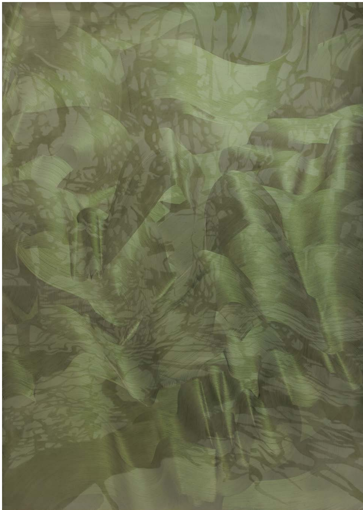
Tiina Pyykkinen, A Room of Absence 2 , 2023, öljy teräkselle.