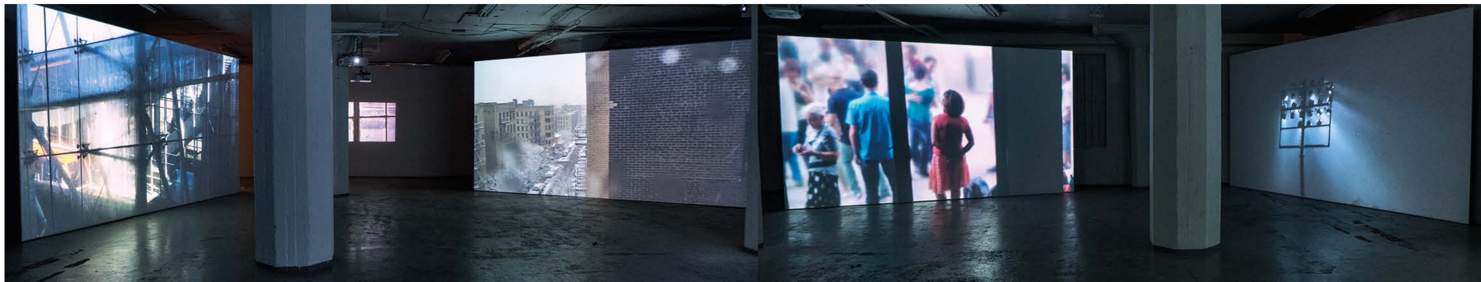
Rita Jokiranta, Life as It Flees , 2017, 5-kanavainen videoinstallaatio. installaationäkymät, Galleria Huuto, Helsinki 2017.

akryylihelmistä ja kivenpalasista. Näyttelyyn valituissa teoksissa pysähdytään tunnepitoisten tapahtumien äärelle. Nousutuki (2020) on tuhansista helmistä koottu luonnollisen kokoinen sairaalasankey, joka on ripustettu korkealta näyttelytilan katosta vaijerien avulla. Teos käsittelee taiteilijan isän kuolemaa. Kirkkaus (2017) puolestaan liittyy muistoon kadonneen koiran kotiinpaluusta. Henkilökohtaisuus tekee Vihriälän teosten kokemisesta yleismaailmallista; ne välittävät tunteita, joihin voimme kaikki samaistua.