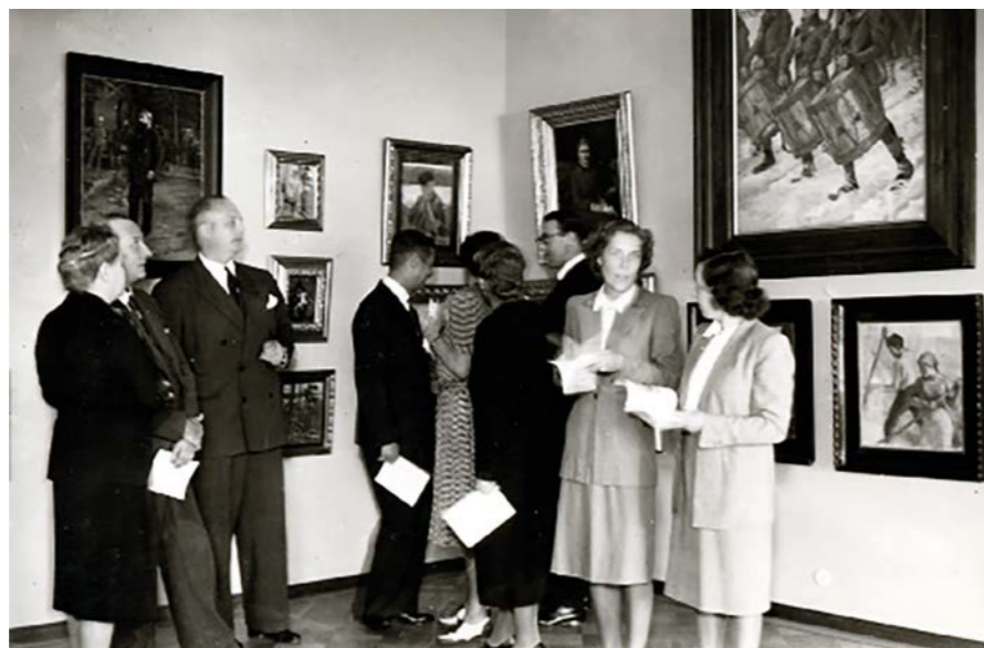
Gösta Serlachiuksen taidemuseon avajaisia vietettiin vuonna 1945, kun osa Joenniemen kartanon alakerrasta avattiin taiteelle.

Taloudellisesti kireimmät ajat olivat 1990-luvun alussa, jolloin Joenniemen museo jouduttiin sulkemaan talveksi ja vähäistä henkilökuntaa lomauttamaan. Taidesäätiön osakeomistukset oli fuusiossa vaihdettu Metsä-Serlan osakkeisiin, joiden arvo romahti syvän talouslaman seurauksena. ”Keskusteltiin jopa siitä, pitäisikö