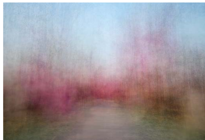
Eeva Karhu, Path (Moments) Autumn 6 , 2019, pigmenttiviedos.