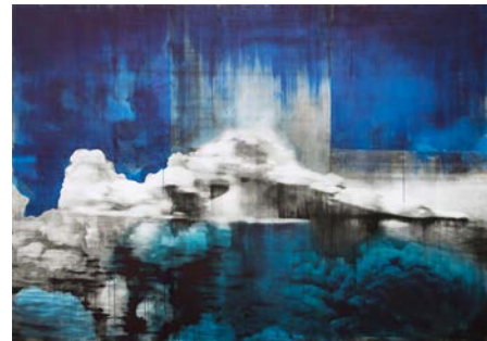
Lorna Simpson, Ice 8 , 2018, muste ja akryyli gessolla pohjustetulle puulle. © Lorna Simpson. Yksityisomistuksessa. Kuva: James Wang.