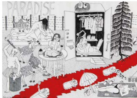
Pirjetta Brander, Paratiisi , 1998, tussi paperille.