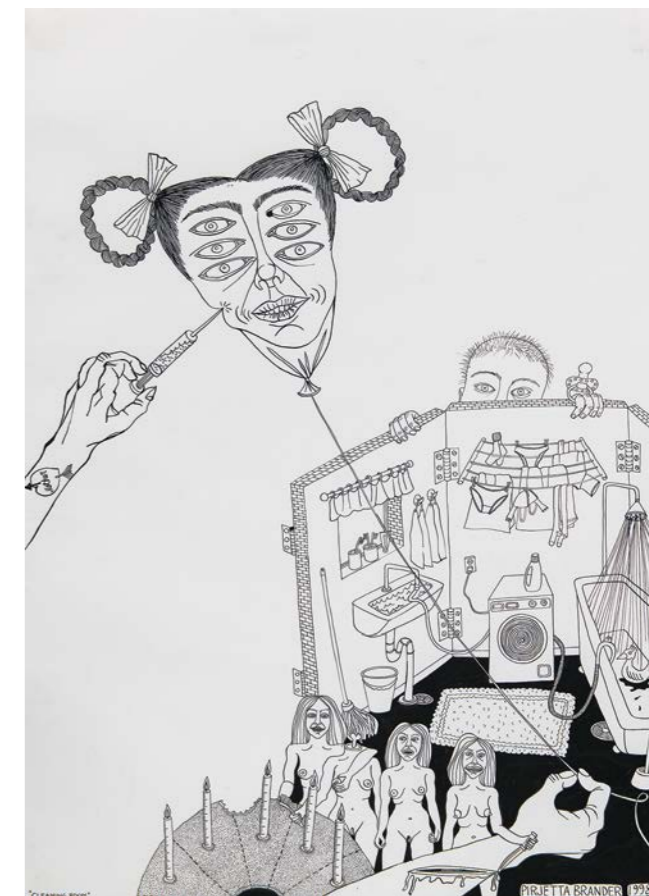
Pirjetta Brander, Huoneen siivous 1 , 1998, tussi paperille.

PIRJETTA BRANDER POHJAVIRTAUS 25.3.-3.9.2023