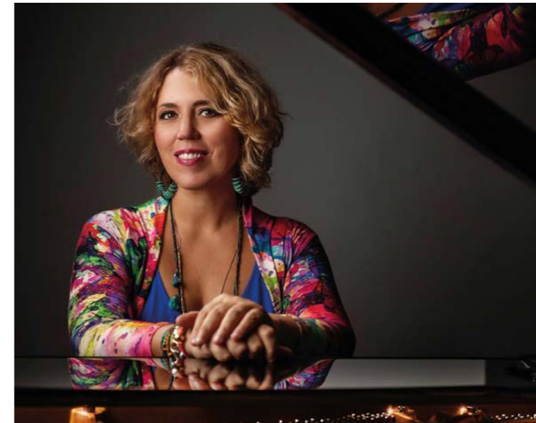
Gabriela Montero esiintyy päätöskonsertissa.